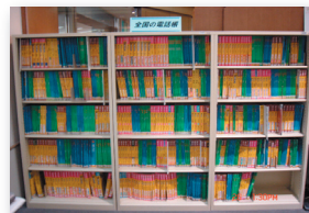
地域活性化コーナー奥の全国の電話帳