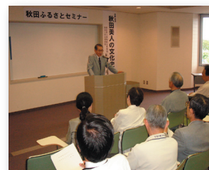
第2回 秋田ふるさとセミナー