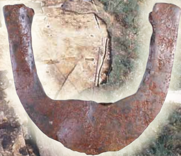
すまさき しやかないなかだい 鉄製鋤先 (釈迦内中台 I 遺跡)